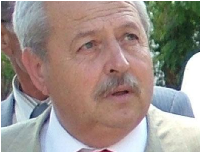
Tuncer; “Son derece tehlikeli”

Son derece sağlığa zararlı olan zira ilaç atıklarının önlenmesi için bazı önerilerde bulunan Berkit; “Bayramiç ilçesindeki zirai ilaç atıkları hem sağlığımız hem de çevre için büyük risk oluşturmaktadır. Böyle önemli bir sorunu Valilik, Kaymakamlık ve yerel yönetimler iş birliği içerisinde çözmelidir. Bu çözümün kalıcı olması için bir anlamda da milletvekilleri düzeyinde olmalı. Bu tür ilaçların depoziteli satılması lazım. Çünkü gelişmiş ülkelerde bu böyle. Mesela fabrikadan ürün çıkarken, geri dönüşümün de maliyetini üzerine koyarak satılıyor. Dışarı bir firmanın boş ürünü olumsuz bir yerde bulunduğu hemen ceza kesiliyor. Kısacası bu ülkede geri dönüşüm için bira şişesini toplattıran mantık, kesinlikle zirai ilaç atıklarını da geri toplatması lazım. Bu konuda bir kampanya düzenlenebilir. Dolusunu aldın, boşunu getirdiğinde şu kadar para alacaksın gibi bir kampanya olabilir. Zirai ilaç atıklarında bu tür kampanyalar düzenlenmeliydi. Ancak geç kalınmış bir konu. Siyasetçilerinde bu konuda kafa yorması lazım. Geçici olarak belediyelerin ya da il özel idaresinin hızlı bir şekilde bu konuya fon ayırarak atıkların geri toplanmasına katkı sunmalı. Bunun kanun düzeyinde bir şeyler yaparak zirai ilaç atıklarının geri toplanması gerekiyor.”