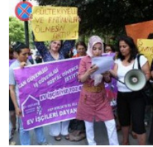
Dövüldü, tartaklandı, 'şüpheli' oldu!