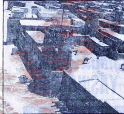
Doğuya özgü, veiv katıllığı geleneği, kimseye, kalın duvarlar arkasındaki çarşafda yasakların uygulanıp uygulanmadığını araştırmak yetkisini vermiyor.