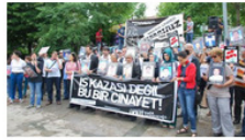
Mayıs ayında en az 114 işçi hayatını kaybetti