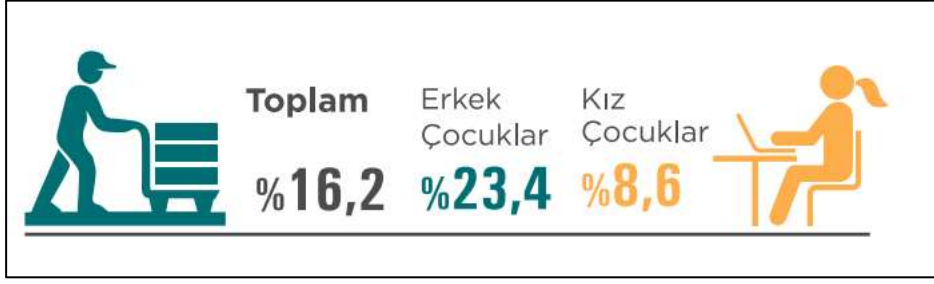
Şekil 3. 15-17 yaş grubunda cinsiyete göre işgücüne 30 000 katılma oranı (%), 2020

COVID-19 pandemisi öncesinde çocuk işçi sayısında bir miktar azalma kaydedilmişken, dünyada olduğu gibi pandemi döneminde bu durumun Türkiye’de de tersine döndüğü düşünülmektedir. Pandemi sürecinde okulların kapanması ve ekonomik yoksullaşmanın ailelerin çocuk işçiliğine ihtiyaç duymasına neden olduğu tahmin edilmektedir. Çalışma Bakanlığı bütçe görüşmelerinde bu gerçek gözler önüne serilmiştir; Bakanlık 2020 yılında çocuk işçiliğiyle mücadele kapsamında 12 bin 457 çocuğa ulaşılmışken, 2021 yılı sonunda ulaşmayı planladığı çocuk işçi sayısı ise neredeyse iki katına (2021 yılı sonunda 27 bin, 2022 yılı sonunda 28 bin ve 2023 yılı sonunda ise 29 bin çocuk) çıkmıştır (21).