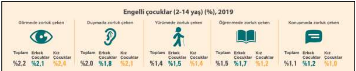
Şekil 2. Türkiye'de engelli çocuklar

Aynı araştırmada ailelerin beyanları doğrultusunda 2-14 yaş grubundaki çocukların %2,2 ile en fazla görmede zorluk çektikleri görüldü. Aynı yaş grubundaki çocukların %2,0'nin duymada, %1,5'inin öğrenmede, %1,4'ünün yürümede, %1,1'inin ise konuşmada zorluk çektikleri ifade edilmiştir (6).