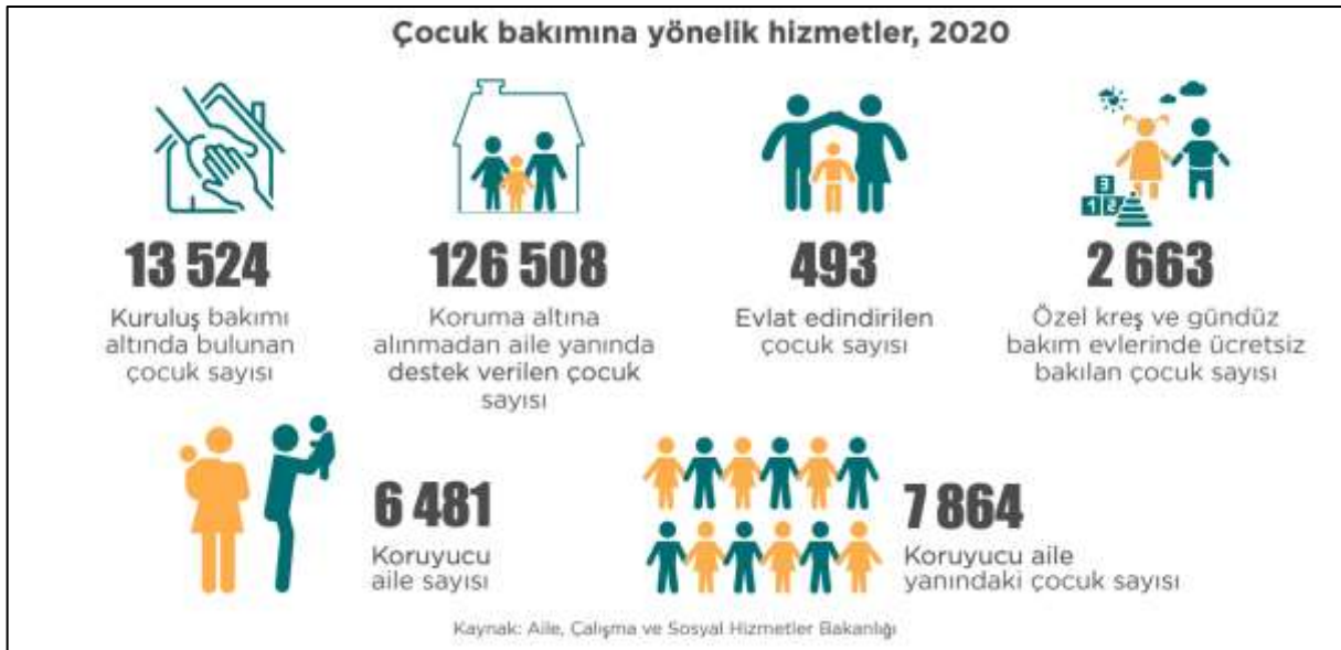
Şekil 5. Türkiye’de Çocuk Bakımına Yönelik Devlet Hizmetleri – 2020

Hukuksal olarak farklı soru işaretlerini oluşturan yasalarımızın “çocuğun sağlık ve iyilik halini korumasına yönelik olarak tutarlılık ve çocuğun üstün yararını gözetecek” şekilde olması gerekmektedir. Yasaların uygulaması sırasında farklı yorumlara açık olmaması sağlanmalıdır.