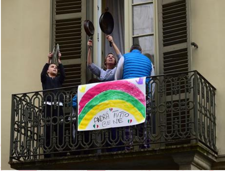
Resim-1: İtalya’da Balkonda Müzik Yapan Ev Halkı

Dijitalleştirilmiş müzeler (British Museum-Londra, The Metropolitan Museum of Art-New York, Pergamonmuseum-Berlin ve Rijksmuseum-Amsterdam, Türkiye’de Pera Müzesi, Sakıp Sabancı Müzesi, İstanbul Modern, Borusan Contemporary, Masumiyet Müzesi, İstanbul Araştırmaları Enstitüsü, SALT, Rezan Has Müzesi, Elgiz Müzesi ve Sadberk Hanım Müzesi), arşivlenmiş bale, opera, tiyatro gibi sahne sanatlarının televizyonlarda gösterime sunulması, pandemi döneminde önemli etkinliklerdir.