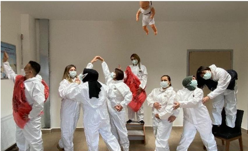
Resim-2: Osmaniye İlçe Sağlık Müdürlüğü Filyasyon Ekibinin Covid-19 Bağlamında Bir Performansı