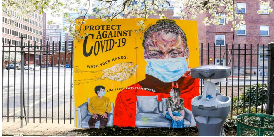
Resim-3: Resim Yoluyla Covid-19 Mücadelesi

Pandemi döneminde bu ve benzeri sanat alanındaki çalışmaları, sanat tarihi seminerleri vb ile çoğaltmak mümkün. Biliyoruz ki unutmak üzere tasarlanan hafızaya kanıt gerek sonrasında. Aşağıda Resim-2-3-4 ve 5’de bu anlamda yapılan sanat çalışmalarına örnekler verilmiştir: