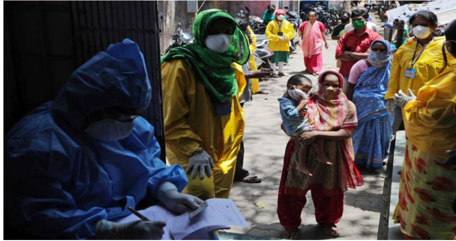
Resim-4: Fotoğraf ve Covid-19